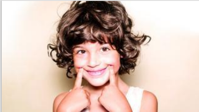
Association Horizon Parrainage - © DR

À Lyon, l'association Horizon Parrainage fondée en 2005 a besoin de bénévoles.